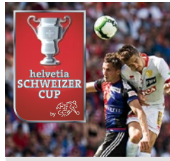
Presenting Partner des Helvetia Schweizer Cup seit 2016.