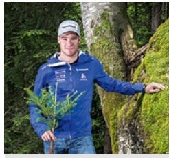
Engagiert im Thema Schutzwald seit 2012.