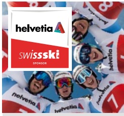
Offizieller Partner von Swiss-Ski seit 2005.

Helvetia ist eine führende Schweizer Versicherung mit massgeschneiderten Versicherungs- und Vorsorgelösungen für Unternehmen und Privatkunden – seit 1858. Helvetia unterstützt gesellschaftliche Engagements.